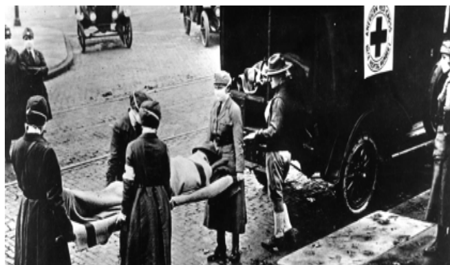
Fotografía de la epidemia de la gripe de 1918 en St Louis (EEUU).

Esta vez, además de atacar el norte y centro, se cebó en las ciudades mediterráneas que en la anterior ola se habían librado. El medio millón de españoles que regresaba de la vendimia francesa y los soldados portugueses repatriados tras la guerra se encargaron de extender la enfermedad por todas las estaciones de tren. Coincidió también, con el relevo de reemplazo militar en España,