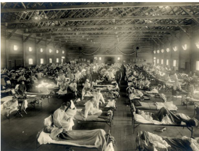
Fotografía sin fecha proporcionada por el Instituto de Patología de las Fuerzas Armadas muestra un hospital de emergencia durante la epidemia de influenza de 1918, en Camp Funston, Kansas.

Entonces gobiernos y sociedades cometieron algunos errores que se han repetido en la actual crisis sanitaria por la COVID-19 y existen algunas similitudes con la pandemia actual.