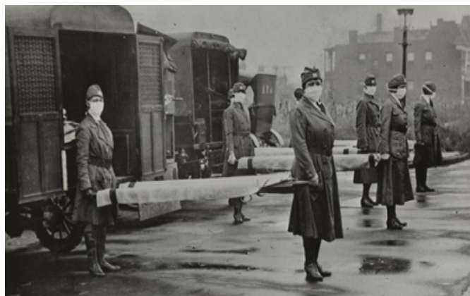
Un grupo de enfermeras de la Cruz Roja en Sant Louis con mascarillas durante la gripe de 1918.

Una vez aceptada la evidencia, se adoptaron medidas llamativas, aunque no sirviesen para nada o fuesen inaplicables, a veces por la huida de las mismas autoridades o del personal sanitario. Lo importante era demostrar a la población que se estaba haciendo algo, evitar el pánico y el desorden social eran el objetivo