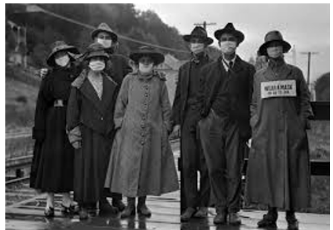
Fotografía tomada durante la epidemia de gripe de 1918. Una de las mujeres porta un cartel que dice "use una máscara o vaya a la cárcel".

El Gobierno de concentración presidido por Maura que había llegado al poder esa primavera, despertando