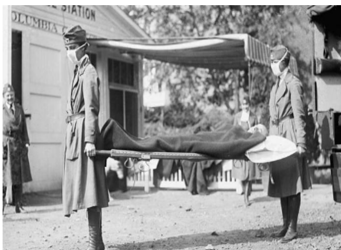
Traslado de heridos durante la pandemia de la gripe conocida como 'española'. El Correo

prioritario. Ello impidió que se tomaran medidas efectivas, aunque impopulares como suspender las fiestas populares, regar las calles con desinfectantes, retrasar el inicio del curso escolar, fumigar con zotal a todos los pasajeros de los trenes, prohibir la compra-venta de ropa usada, cerrar cines, teatros, campos de fútbol, plazas de toros, etcétera. A la Iglesia se le pidió restringir los servicios religiosos.